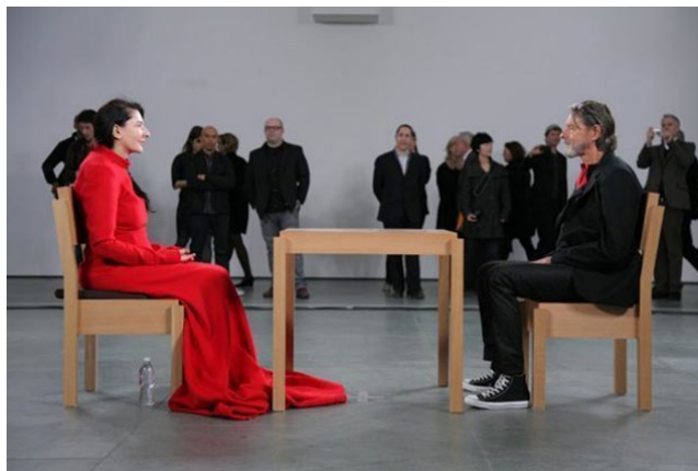
Figura 2: Marina Abramovic, A Artista Está Presente. 2010.